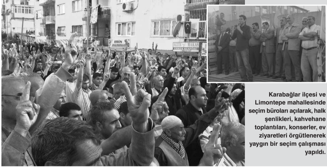
Karabağlar ilçesi ve Limontepe mahallesinde seçim büroları açılarak, halk şenlikleri, kahvehane toplantıları, konserler, ev ziyaretleri örgütlenerek yaygın bir seçim çalışması yapıldı.

Karabağlar ilçe sözcülerinden biri olarak BDP ilçe yönetimiyle, seçim çalışmalarının merkezileşmesi için her hafta örgütlenen İzmir 1. Bölge toplantılarına katıldık. Bu toplantılarda BDP ilçe yönetimiyle birlikte ilçede yürüten çalışmaların raporlarını sunarken başka ilçelerde yürüten çalışmalar hakkında bilgi edindik.