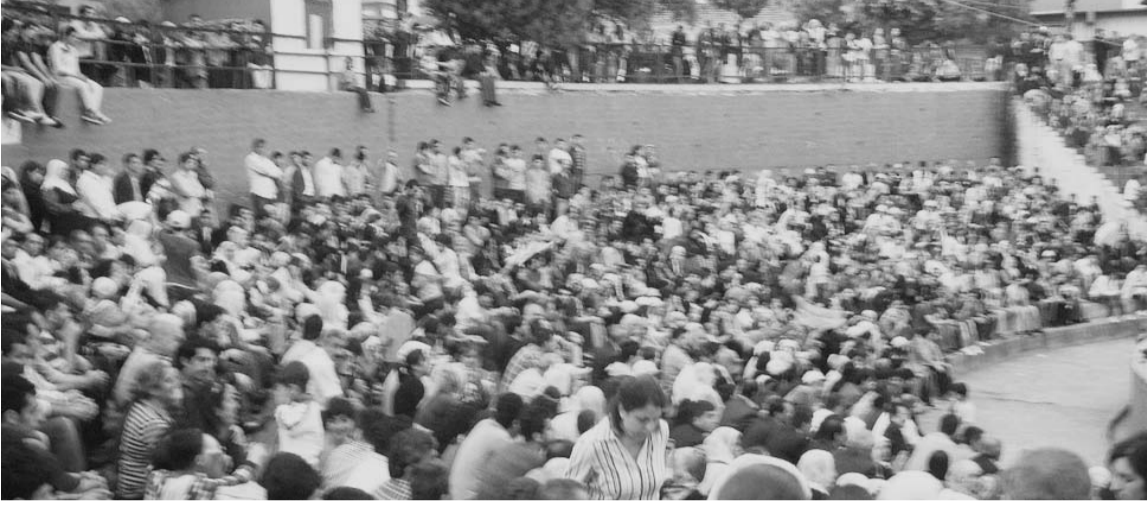
Okmeydanı'nda 7 Mayıs'ta 2. Bölge Blok aday bürosuyla çalışmalara başladık. Semtteki çalışmalar Emek Demokrasi ve Özgürlük Bloku bileşeni olan

BDP, EMEP, KÖZ, SODAP ve bağımsız bir arkadaş grubu tarafından yürütülüyor. Çalışmaları dört ayrı mahalle üzerinden planlayıp buna göre hareket ediyoruz.