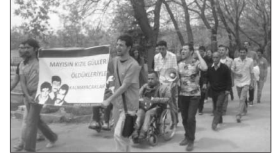
Bu yıl mezar başında dört ayrı anma gerçekleşti

Önümüzdeki dönemde tüm devrimci ve sol güçlerin karşısındaki soru budur. Bu sorunun yanıtının ne olacağı da odağında BDP'nin durduğu eylemli bir savunma hattının örülüp örülemeyeceğine bağlıdır.