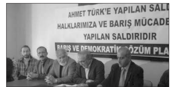
Platform ziyaret programını bir basın toplantısı ile duyurdu

Deniz GEZMİŞ, Yusuf ASLAN ve Hüseyin İNAN'ın idam edililerinin 38. Yıldönümünde mezarları başında andık. Bu yıl mezar başında dört ayrı anma programı gerçekleşti. İlk anmayı saat 10.00'da Mücadele Birliği Platformu gerçekleştirdi, arkasından da BDSP de kendi anmasını gerçekleştirdi. Saat 12.30'da EMEP, BDP, SDP, EDP, ESP, TÖP, KESK Ankara Şubeler Platformu, PSAKD ve Kızıllırmak Köy Dernekleri Federasyonu'nun ortak çağrısını yaptıkları anma programı başladı. Bu anmanın bitmesi ile Devrimci 78'liler Federasyonu, 68'liler Dayanışma Derneği, Ankara Halkçileri, ABF, Devrimci Hareket, ÖDP, SDP, TKP'nin düzenlediği anma gerçekleşti. SAYFA 3