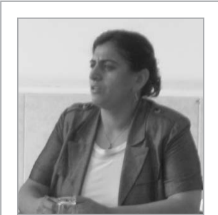
Halk toplantısına İstanbul milletvekili Sebahat Tuncel de katıldı

Mitingde KÖZ olarak "Evet Hayır Dayatmasına Geçit Yok Referandumla Yanıtımız Boykot" ve "Demokratik Anayasa için Kurucu Meclis; Kurucu Meclis için Yasaksız, Barajsız, Tehditsiz Seçim" pankartlarını taşıdık. Yürüyüş boyunca ve alanda "Demokratik anayasa için kurucu meclis; kurucu meclis için yasaksız, barajsız, tehditsiz seçim"; "Demokrasi için Kürtlere özgürlük"; "Nereden Geliyoruz: Varoşlardan, Ne İstiyoruz: Özgürlük; Vermeyecekler: Alacağız, Özgürlük Savaşan İşçilerle Gelecek!" sloganlarını attık. 6'da