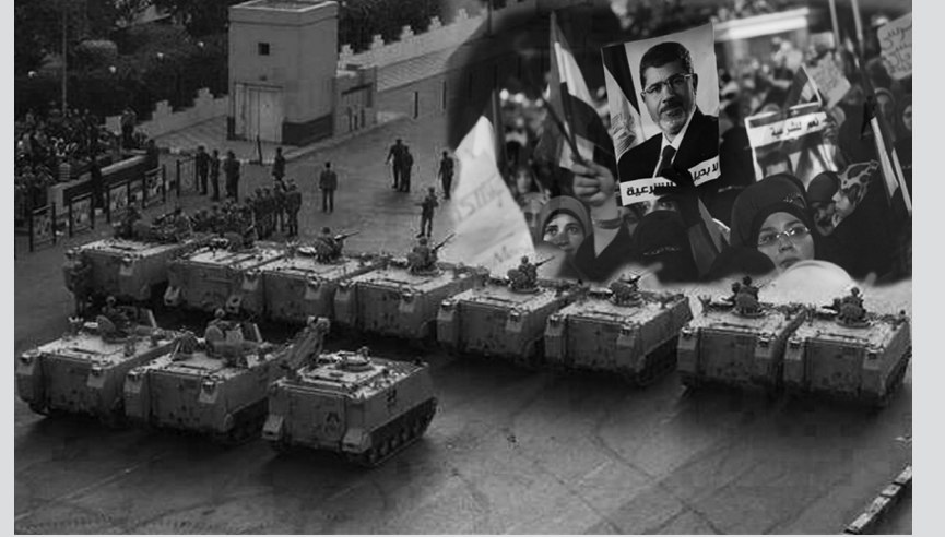
Bayrak ve troçkist akımların tipik örneklerini sergilediği- bakış açısıyla elbette bağdaşmaz.

Ancak Mısır'daki süreç 2011'dekinin tümüyle aynıysa değildi, zira Mübarek'in aksine İhvan'ın Mısır'da ciddi bir tabanı olduğu gibi İhvan, hükümeti kolay kolay elinden bırakmaya niyetli değildi, son günlerdeki çatışmalar da bu durumu göstermektedir. Dahası hali hazırda ordunun da İhvan'ı siyaset sahnesinden silebilecek bir çapı olduğu söylenemez. Tahrir alanı, darbecilerle iş tutmaya niyetli muhalefet liderlerinin marifetiyle boşalırken Adeviye alanının kitlesel bir muhalefet merkezi olarak kalması da bu durumu doğrulayan bir gelişmedir. Kuşkusuz Tahrir'i dolduran kitlelerin bir anda buharlaştığını söylemek doğru değildir. Ancak önümüzdeki dönemde Mısır'da hali hazırda tarafları burjuva siyasetindeki gerilimlere bağlı olarak şekillenmiş bir kampaşmada darbecilerin yanında yedeklenmiş ve elbette devrimci dinamiklerini yitirmiş bir kitle hareketiyle karşı karşıya kalacağız. Bu tespit, kitle hareketin durmaksızın büyüyüp önündeki engelleri devire devire devrimci bir çizgiye varacağını ileri süren –bugünlerde Kızıl