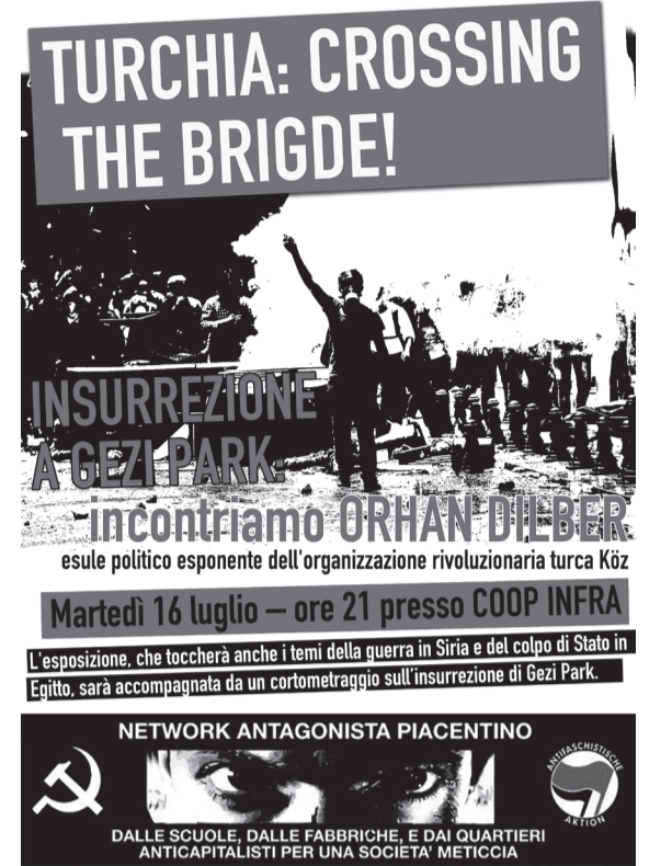
Piacenza Türkiye: Köprüyü Geçerken Gezi Parkında Ayaklanma

Gezi ayaklanması üzerine yoğunlaşan sorula-