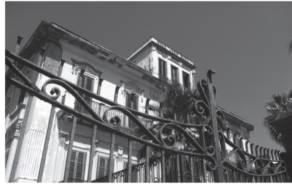
Villa Medusa /İtalya

Napoli'deki söyleşi PM/Combate platformuna yakın zamanda dâhil olan bir yerel örgütün başı-