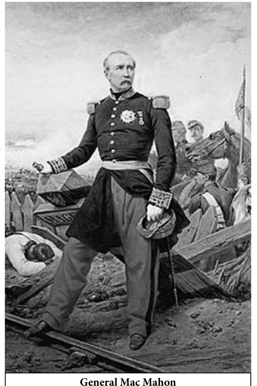
General Mac Mahon

Bu tür sembolik eylemlerin sonucusu kanlı haftanın ilk gününde monarşinin sembolü ihtişamlı Tuilleries (tüileri) Sarayının yakılması olacaktı. O sarayın halen sadece bahçesi bulunmak-