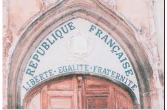
Jakoben laikliğin neye benzediğini en iyi gösteren resimlerden biri budur: Fransa'da bir kilise; kapısında Fransız Cumhuriyeti ve eşitlik kardeşlik özgürlük yazılı

Madde 1. Kilise ile Devlet birbirlerinden ayrılmıştır.