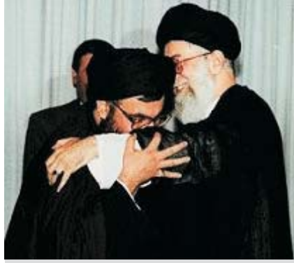
Nasrallah ve Hamenei

1982'de İsrail'in Galile Harekatı adını verdiği bir hareketle, Filistin kamplarını gerekçe göstererek Lübnan'ı işgal etmesi üzerine Humeyni gizlice 3000 eğitimli muhafızını Lübnan'a gönderdi. Bu 3000 muhafız, Lübnan'da bugünkü Hizbullah'ın örgütlenmesini başlattılar. Ağırlıklı olarak Güney Lübnan'da Baalbek ve Bekaa Bölgesi'nde örgütlendiler. Bekaa Bölgesi, bugün Hizbullah'ın genel sekreteri olan Hasan Nasrallah'ın Emel Örgütü'nde sorumluluk aldığı bölge idi. Bu yıllar aynı zamanda Emel Örgütü'nde parçalanmaların yaşandığı bir dönemdi. Aynı süreçte Nasrallah ve yanındaki 500 kişi Emel'den ayrılarak Hizbullah'a katıldılar. O zamandan beri de Lübnan'daki Şiiileri temsil eden iki örgütten biri Hizbullah diğeri Emel oldu. Hizbullah'ın kuruluşundan tam 10 yıl sonra