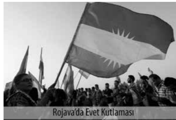
Rojava'da Evet Kutlaması

Bununla birlikte sonucunun bağımsızlıktan yana olacağı konusunda kuşku duyulmayan bu referandum girişimi esasen Kürdistan'daki gelişmeler karşısında KDP'nin, konumunu korumak için bir manevrası olarak görülmelidir. Bir yandan Rojava Devrimi'nin Başur'da (Güney Kürdistan'da) yarattığı etkiyi nötralize etmek, diğer yandan da PKK'nin ulusal kongre girişimlerine karşı bir denge oluşturmak üzere başvurduğu bir taktik hamle olarak görülmelidir. Bu aynı zamanda Rojava Devrimi'nin Başur üzerinde bir etki yarattığı