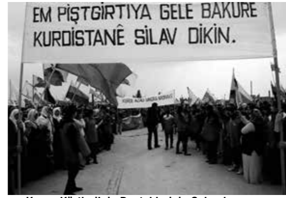
Kuzey Kürtleri'nin Desteklerinin Selamlıyoruz

Rojava Devrimi herkesi olduğu gibi Güneyli Kürtleri de şaşırttı. YPG'nin PYD dışındaki Kürt örgüt ve gruplarının devrime ancak kendi komutası altında katılabileceklerini dayatması üzerine devrime aktif bir güç olarak katılmama kararı verdiler. Oysa kendileri de Güney Kürdistan'da benzer bir dışlayıcı tutumu sürdürmekteydiler. Bu durum üzerine Erdoğan ve T.C., Kürtler arasındaki anlaşmazlığı kendi lehine kullanmaya yöneldi. Öyle ki Rojava kantonlarının özerklik ilanını takiben İŞİD'in saldırılarına ve T.C.'nin tehditlerine maruz kalarak Güney'e sığınmaya yönelen Kürt-