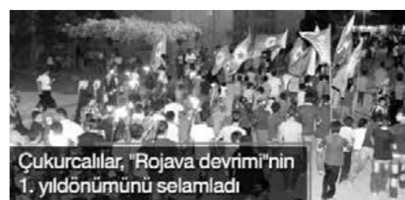
Çukurcalılar, "Rojava devrimi"nin 1. yıldönümünü selamladı

Oysa pek çok akım ve şahsiyet Rojava Devrimi'ni desteklemek için, doğrudan demokrasi yahut kimi liberter çağrışımli pratik uygulamaları öne çıkardı. Kimileri de öteden beri benimseyip yüceltikleri askeri devrim stratejilerini hatırlatan, nostaljik eğilimleri tetikleyen silahlı direniş destekçilerinin yazılmasını öne çıkaracaktı.