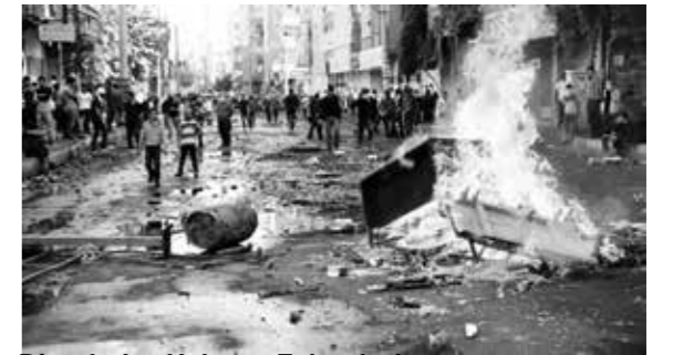
Diyarbakır Kobane Eylemleri

Bugün elbette 12 Eylül'ü önceleyen kriz döneminden farklı koşullardayız. Bir bakıma devrimciler açısından koşulların daha olumsuz olduğunu söylemek mümkündür; tüm tasfiye girişimlerine rağmen devrimci hareketler bütünüyle tasfiye olmasa da reformist akımlar çok daha etkilidir. Fakat 12 Eylül rejiminin düzen güçleri tarafından çözülemeyen krizinin, ezilenler lehine çok daha olumlu nesnel koşullar yarattığı ortadadır. Ülkedeki siyasi krizin bir sonucu olarak ve aynı zamanda siyasi krizi derinleştirip rejim krizine evirtten bir neden olarak Türkiye tarihindeki en büyük hükümet karşıtı ayaklanma olan Gezi Ayaklanması yakın bir dönemde aynı tarihsel zeminde yaşanmıştır. Dahası Rojava Devrimi'nin etkisiyle bundan bir sene sonra Kobane Ayaklanması baş göstermiştir. 2015 7 Haziran'da rejimin kritik mekanizmalarından biri daha boşa düşmüş, yüzde 10 barajının yıkılması krizi derinleştirmiştir. Dahası Kürdistan'ın farklı bölgelerinde silahlı halk ayaklanmaları yaşanmıştır. 15 Temmuz 2016